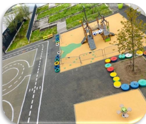
Lieu de vie agréable