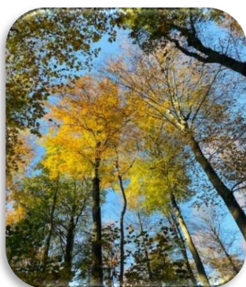
Respect de l'environnement