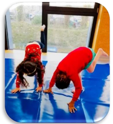
Apprentissages par le corps