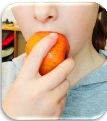
Collations = Fruits/légumes non-transformés