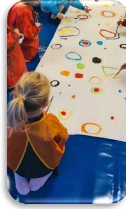
Des projets artistiques