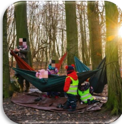
Ecole du dehors