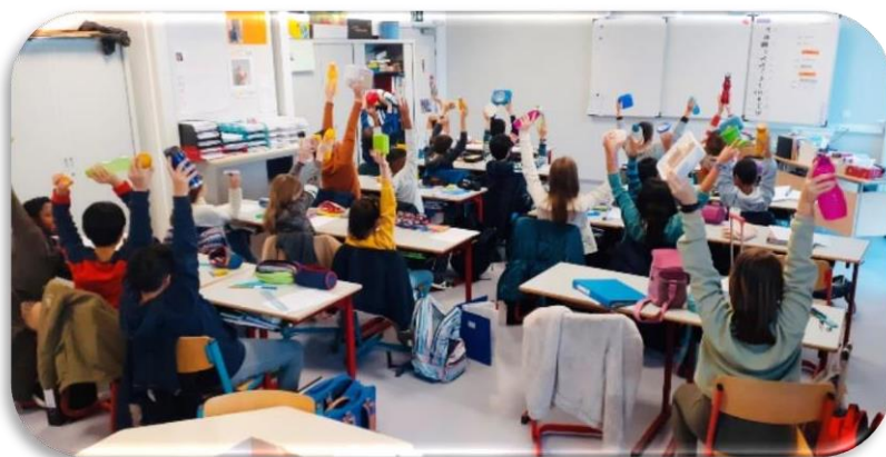
Sensibilisation au zéro déchet