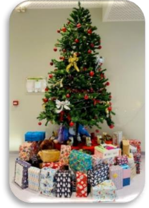
Solidarité Opération Shoe-Box