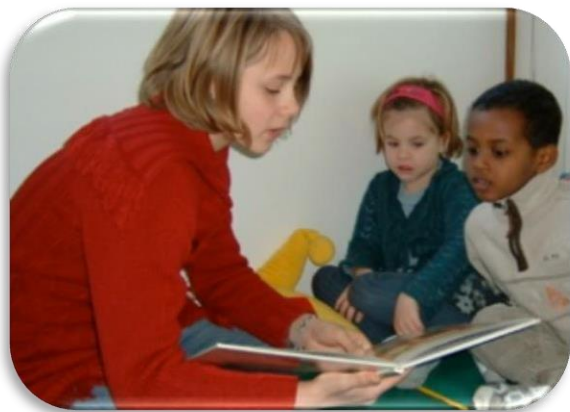
Moment de lecture